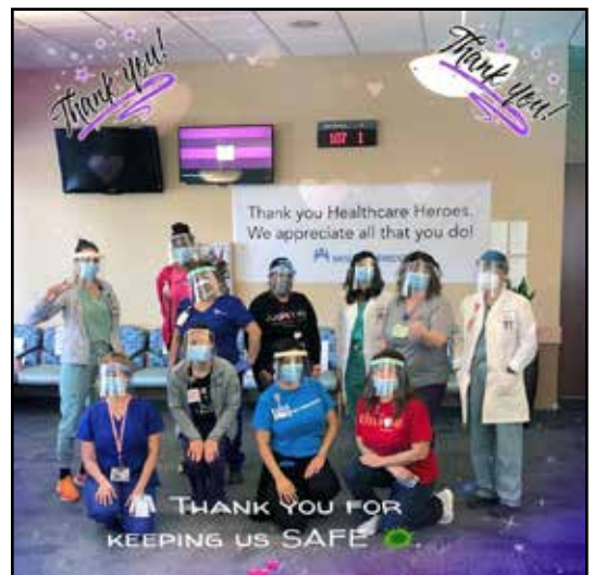
Thank You postcard from health professionals at Kaiser Permanente to SAP-VN for PPE donation