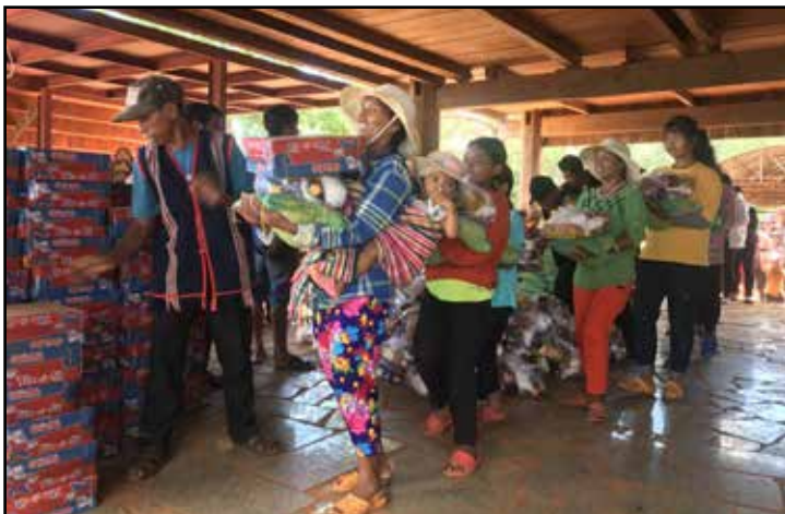
Bà con vui mừng nhận quà cứu trợ

Các trung tâm mồ côi, nhà dưỡng lão nghèo ở các vùng xa xôi hẻo lánh càng bị thiếu hụt trầm trọng về lương thực, thuốc men. Tình trạng bị cô lập của họ rất bi thảm. Nhận thức sự cấp bách cứu trợ cho những nạn nhân trên, hội đồng quản trị SAP-VN đã tán thành chương trình "Cứu trợ đại dịch Covid-19" với số tiền tài trợ là 30,000 USD dành cho những trung tâm mồ côi, dưỡng lão, và người nghèo ở các vùng xa vùng sâu. Dự định sẽ cung cấp lương thực và nhu yếu phẩm cho một người đủ để sống một tháng. Một phần quà cụ thể là 10kg gạo cho mỗi người và nhu yếu phẩm hay thuốc uống, trị giá khoảng $23 (500,000 VND) và sẽ ưu tiên chuyển theo nhu cầu của từng địa phương.