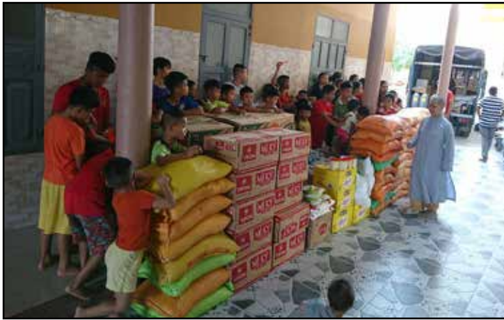
Trao quà tại viện mồ côi

có 67 nóc nhà. Ai cũng nghèo như nhau hết, soeur không biết chọn 50 nhà nào, cho nhà nào bỏ nhà nào bây giờ?" Chúng tôi hiểu tình trạng khó xử của Sœur nên chúng tôi chia xẻ, gói ghém, và chạy mua đồ gói thêm cho đủ. Nhìn mọi người vui vẻ nhận quà làm sự kiện nhỏ trở thành việc làm có ý nghĩa. Khoảng 3000 người nghèo miền Trung đã nhận được gạo và thực phẩm, giúp đỡ phần nào cuộc sống khó khăn của họ.