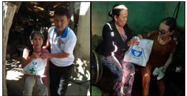
Thành viên nhóm SPM đến tận nhà và trao quà tận tay cho các cụ cao niên và người mù

Cảm ơn rất nhiều các bạn tại Việt Nam trong nhóm thiện nguyện SPM đã lên khuôn cho chương trình và đã chuẩn bị mọi việc xong xuôi.