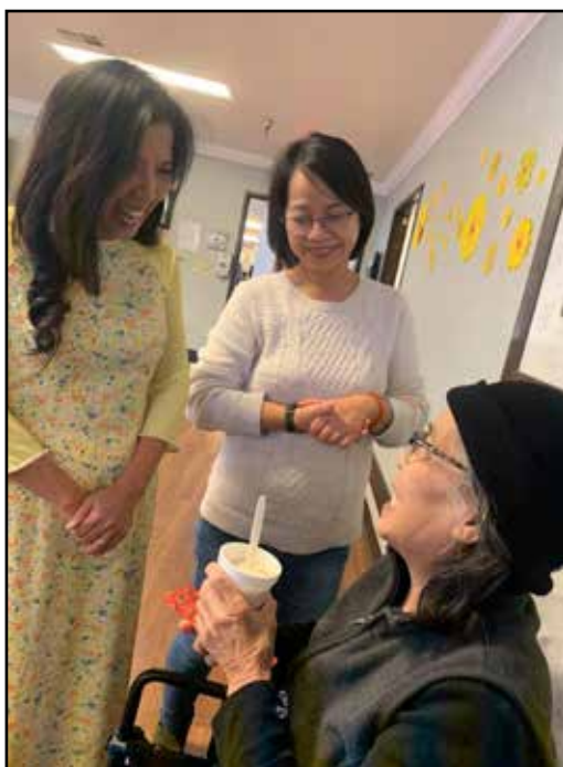
SAP-VN volunteers "Chúc Tết" and "Li Xi" seniors at Mission Palms center in January 2020 prior to Covid-19 shelter-in-place order

Together with the homeless project, nursing home visits have been our routine activity for local volunteers to get involved. This is a truly fun activity, and the dynamic and atmosphere are different at each visit. I want to use this article to express our gratitude to the volunteers who have accompanied us over the last few years. Our mission would not be complete without you who play instruments, sing, dance, and entertain seniors. In the last few years, we have made monthly visits to nursing homes including Garden Grove Convalescence Hospital, Garden Park Healthcare Center, and Mission Palms Health Center. This also gives the elderly the chance to enjoy themselves through their love of singing. It really brings joy to not only residents but also us as volunteers. The two-hour slot always feels short.