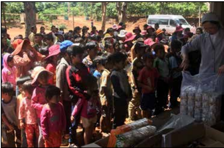
Quang cảnh bà con tập trung chờ các Soeur phát quà

Vào khoảng tháng 2, 2020, bắt đầu sau Tết Nguyên Đán, VN đã áp dụng cách ly xã hội để phòng chống dịch Covid-19. Mọi việc di chuyển và du lịch đều bị hạn chế. Điều này có ảnh hưởng rất lớn với những trung tâm mồ côi và nhà dưỡng lão. Những trung tâm này thường sống nhờ vào quyền góp của các nhà hảo tâm và quà tặng của các du khách. Kinh tế bị trì trệ và không còn du khách đến thăm, đồ tặng, tiền quyền góp gần như cạn kiệt.