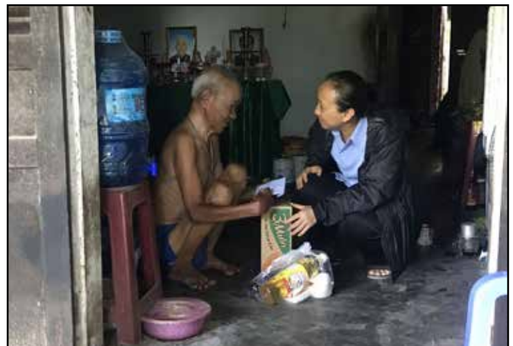
Trao quà tại nhà cho các cụ cao niên

Vào cuối tháng 3, các cộng tác viên của SAP-VN liên lạc với các trung tâm mồ côi ở Bến Tre, Bảo Lộc, Vạn Ninh, Quảng Nam, Cần Thơ... tìm hiểu về tình hình của họ và xác định phương pháp đem quà đến trung tâm. Lúc này, VN đã áp dụng cách ly toàn quốc, cấm tập trung nên sự chuyển chờ hay di chuyển rất khó khăn. Những người ở trại mồ côi rất mừng và cảm kích món quà tình thương trong hoàn cảnh tai ác này. Gần 2 tháng nay họ hầu như không nhận được sự trợ giúp từ bên ngoài. Lương thực gần như cạn kiệt. Khi được hỏi vì sao họ không nhắn tin cho các nhà hảo tâm ở VN hay ở Mỹ biết? Một sự cố trong coi trung tâm mồ côi khoảng 90 trẻ ở Ninh Hòa, Khánh Hòa, ngân ngại nói "cô thấy nạn dịch này dữ quá. Ở VN, bị bệnh có mấy người mà đã khổ vậy rồi. Ở Mỹ có tới mấy chục ngàn người bệnh chắc còn ghê hơn nữa. Cô thấy ai cũng có khó khăn nên không dám xin." Theo số trẻ, trung tâm mồ côi được SAP-VN trợ giúp 9 tạ gạo, đồ khô, nước tương, tã, sữa em bé, xà bông, kem đánh răng. Chúng tôi cung cấp theo nhu cầu của trung tâm để không mua những thứ không cần thiết. Sự trợ giúp đến rất đúng lúc, đúng như câu nói "một miếng khi đói bằng một gói khi no". SAP-VN đã giúp được hơn 1500 trẻ em và người già trong tháng tư.