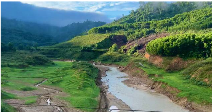
On the way to Nam Trà My. It took 3 hours but the scenery was spectacular

Kudos to our amazing mobile care team. Our team members performed amazingly well even after our daily 2-3 hours drives to work sites. We pride our team for providing care with utmost professionalism and passion. Our younger volunteers of the next generation were impressive in the way they connected to our patients despite the language and cultural barriers.