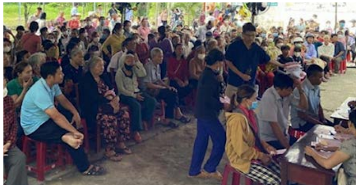
Despite the rain and the treacherous roads, hundreds of people showed up each day, anxiously waiting to be seen