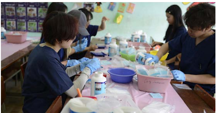
The Pharmacy team working non stop to fill more than 1000 prescriptions each day