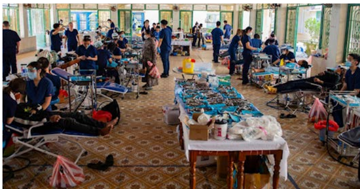
The dental team took over the entire conference hall, with all equipments being set up in less than 30 minutes