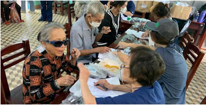
Optometry team busily screening and distributing glasses